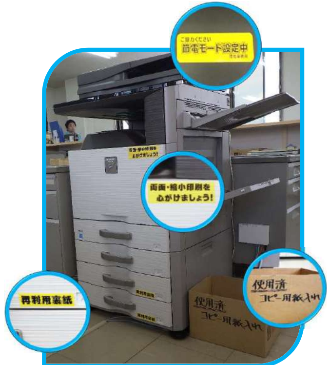
事務所のコピー/FAX/プリンタ/スキャナ複合機は、環境保全を 推進できる宝船。電力・紙資源・プラスチック廃棄物等、色々やってます！！