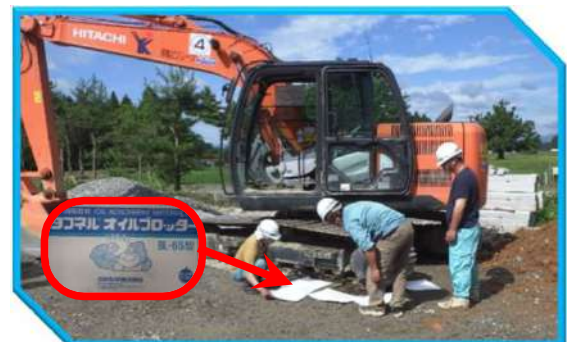
③ 油吸着マットで油流出の拡大を防止