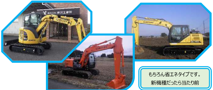
もちろん省エネタイプです。 新機種だったら当たり前