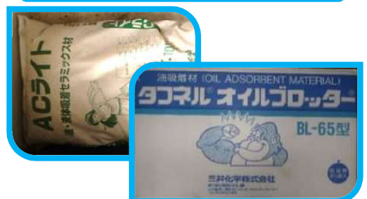
油吸着マット（環境マーク付き製品）