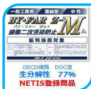
油分解洗浄剤（NETIS対応製品）