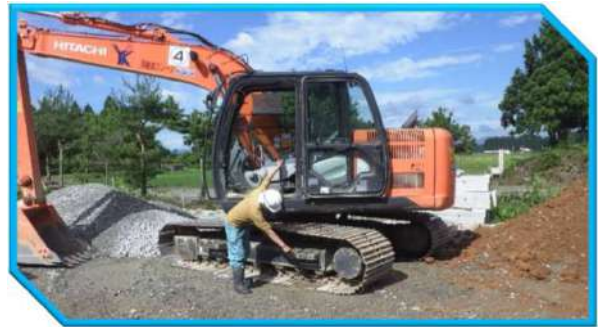
② 油の流出を発見（油圧モーター部を想定）