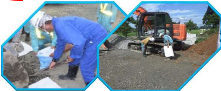
⑤ 油汚染された油吸着マット等を回収及び最終確認