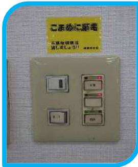
「こまめに節電」 照明の電気料金は 馬鹿に出来ません