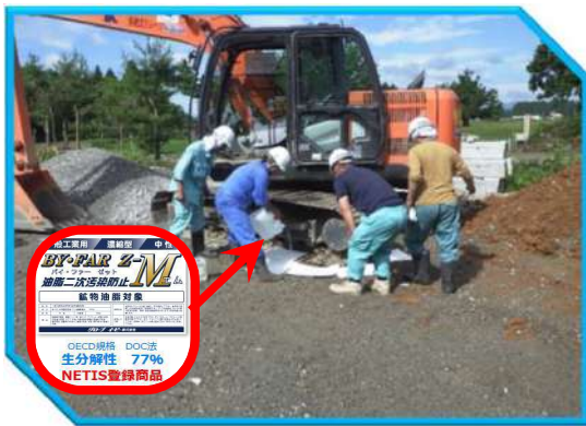
④ 油分解洗浄剤による中和作業