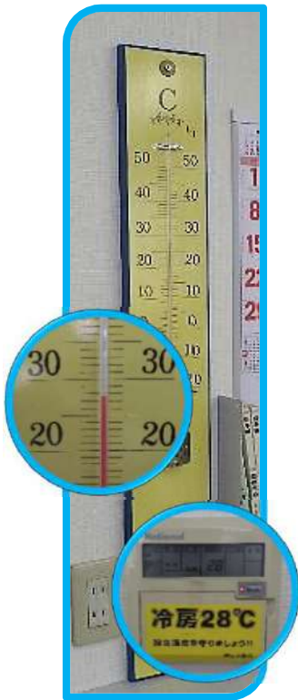
どてかい寒暖計で冷房28℃を 暖房は20℃を閉めています