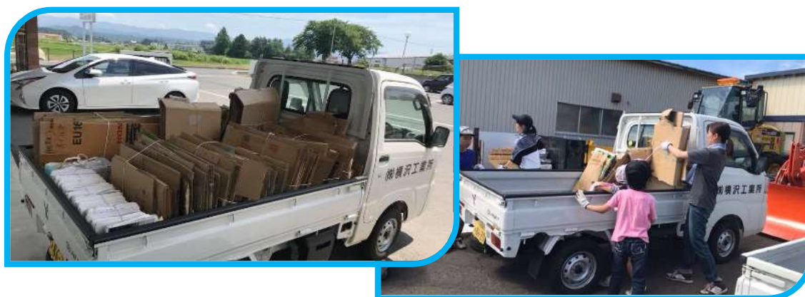
地域子供会へのダンボール寄付