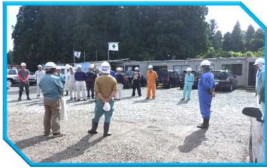
① 訓練前の打ち合わせ