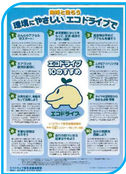
車輛の燃料削減取組、まずは、 「エコドライブ10のすすめ」が効果的です